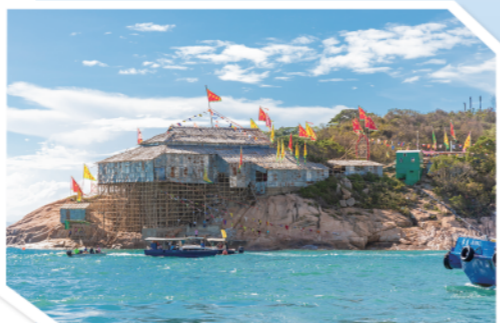
▲香港蒲台岛天后诞的“龙船脊”戏棚依山而建,建筑难度甚高,可谓鬼匠神工。