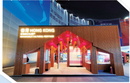
▲“香港非物质文化遗产”展台。