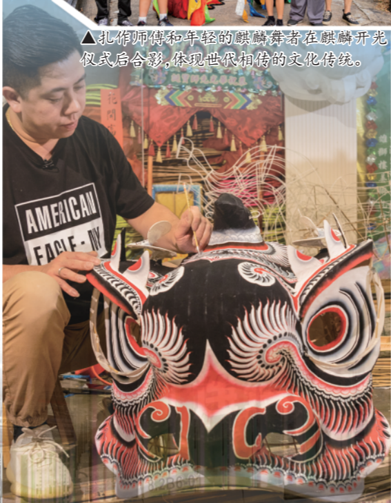
▲扎作师傅正为关羽狮子头写色。