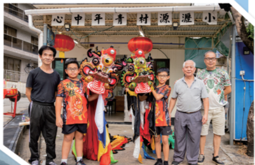
▲扎作师傅和年轻的麒麟舞者在麒麟开光仪式后合影,体现世代相承的文化传统。